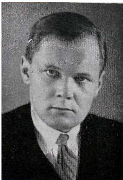
Mynd úr Menntamál , X. árg., maí-sept 1937, bls. 81.